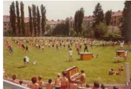
120. ATG Sommerfest - Sportstunde mit Klavierbegleitung