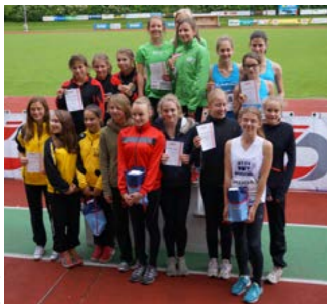
Siegerehrung der sechs besten Mannschaften Österreichs