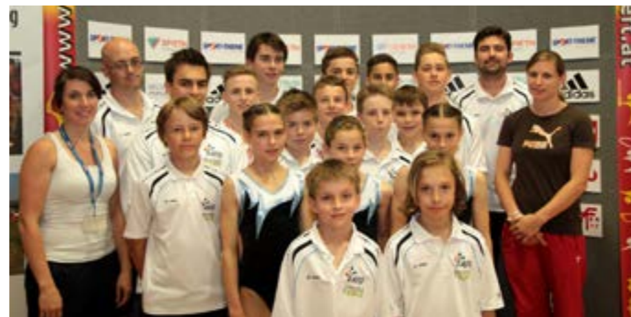
Kunstturnerinnen und Kunstturner des ATG mit ihren Trainern

Sensationeller Erfolg bei den Österreichischen Jugendmeisterschaften im Kunstturnen in Mattersburg!