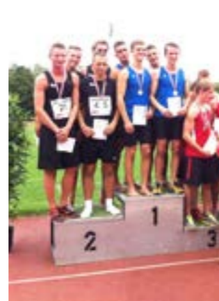
U23 Staffel am 2. Platz