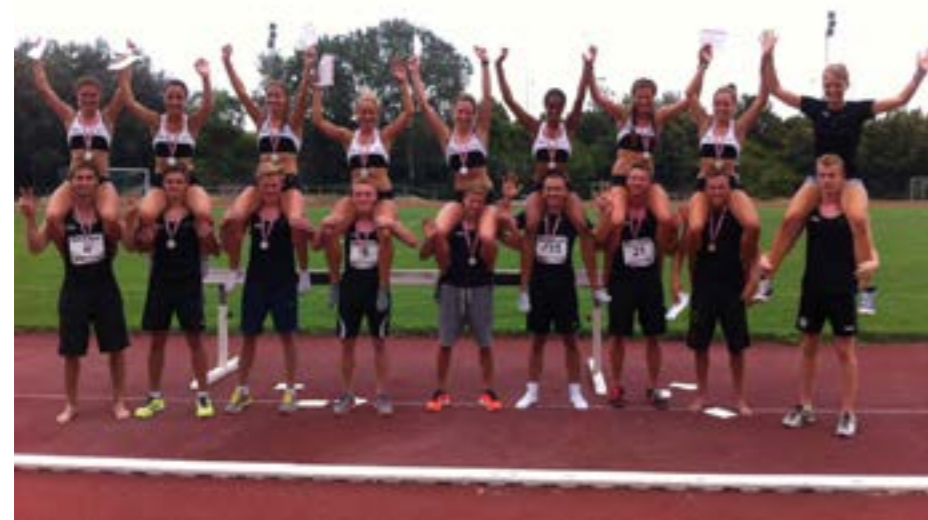
Unsere U18 und U23 Leichtathleten in der Südstadt