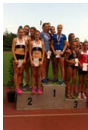
U18 Damen Staffel am 2. Platz